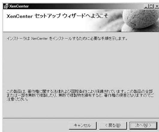
図6.1 XenCenterセットアップ画面 普通のWindowsアプリケーションと同様にインストール ルできる。

ウィンドウの下半分に表示されている [すべてのユーザー] [このユーザーのみ] の項目は、XenCenterの使用権限の設定です。XenCenterをインストールしたユーザーだけに与えるか、そのWindows PCの全ユーザーに与えるかを選択することができます。PCの利用形態とセキュリティ