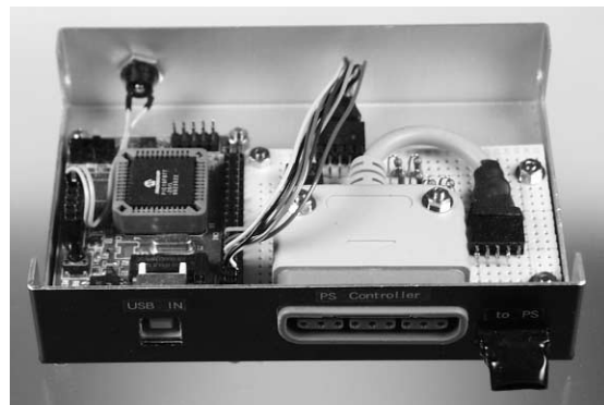
写真4-1-1 製作したコントローラ・アダプタ